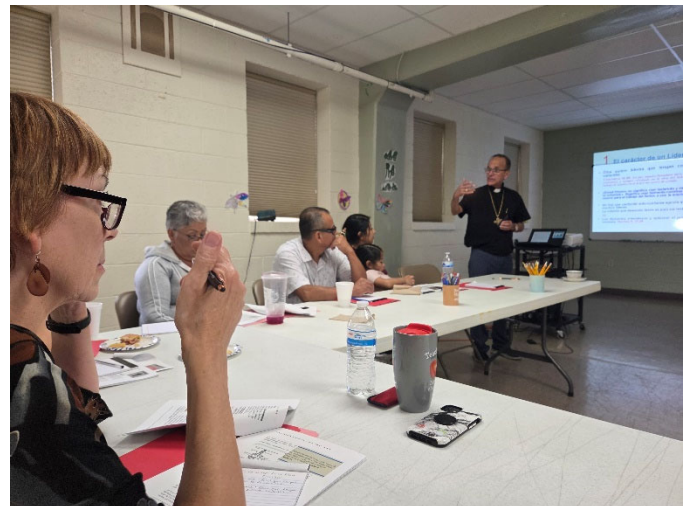
Taller de Liderazgo para los Ministerios Hispánicos del Sínodo