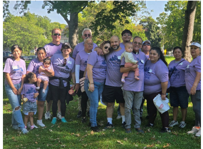
Evento Outreach For Hope con Santa Fe, 27 de septiembre @ Washington Park