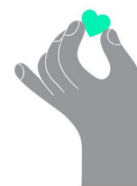
Thrivent Choice Dollars

Un gran AGRADECIMIENTO a todos los miembros de Thrivent que donaron sus dólares de Thrivent Choice a AMIS. ¡Cada dólar nos ayuda a seguir siendo una bendición para los demás!